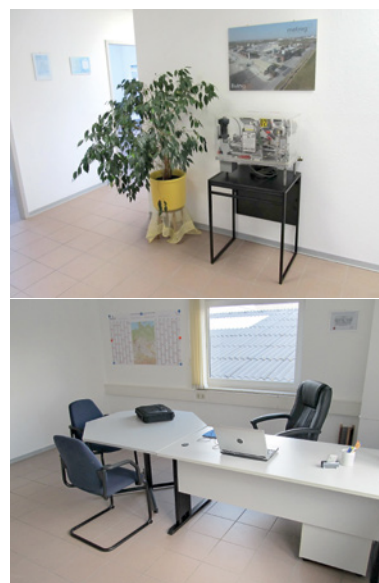
Eingangsbereich und Büro der Metreg Solutions GmbH.

Die Zertifizierung nach DIN ISO 9001:2008 für Metreg Solutions ist bereits erfolgt.